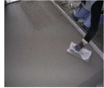
Alisamiento con llana de la superficie final