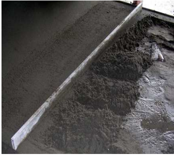
Colocación del mortero

Para aplicar el revestimiento se debe esperar al menos de 48 a 72 horas, dependiendo de las condiciones meteorológicas y del tipo de acabado deseado. El revestimiento final sobre el recrecido debe aplicarse de acuerdo con las normas y condiciones recomendadas por el fabricante del revestimiento, respetando escrupulosamente el contenido de humedad requerido.