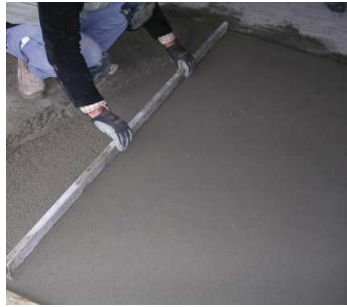
Nivelación con un reglón metálico.